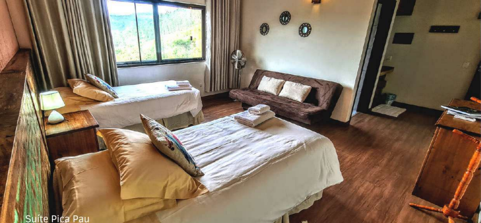
Suíte Pica Pau