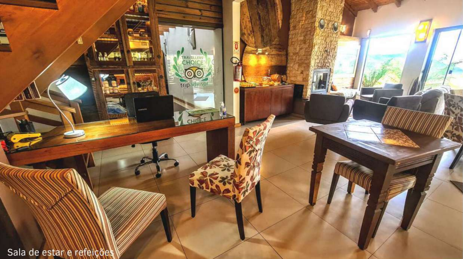
Sala de estar e refeições