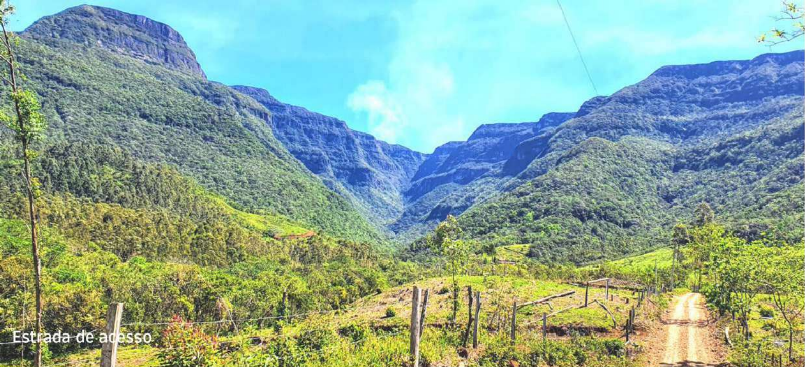
Estrada de acesso