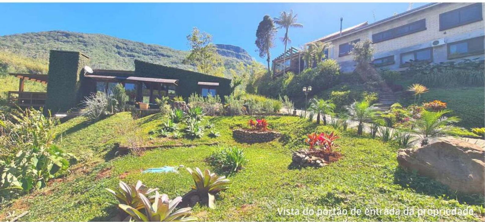
Vista do portão de entrada da propriedade