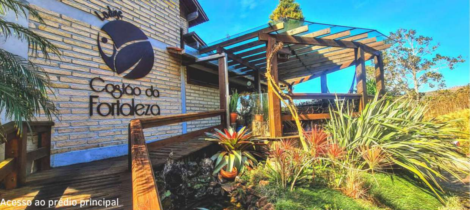
Acesso ao prédio principal